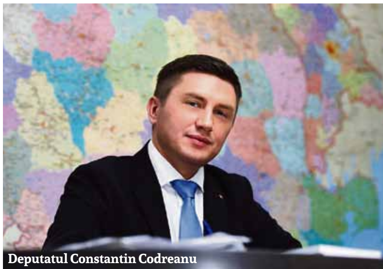
Deputatul Constantin Codreanu

Strict statistic, unui etnic neromân din România i-au fost alocați în medie 55,12 lei (circa 12 euro - n.r.), iar unui român de pretutindeni - 0,66 lei de la buget, (circa 15 cenți - n.r.), ceea ce face un raport de 83,5 la 1, în favoarea etnicilor neromâni